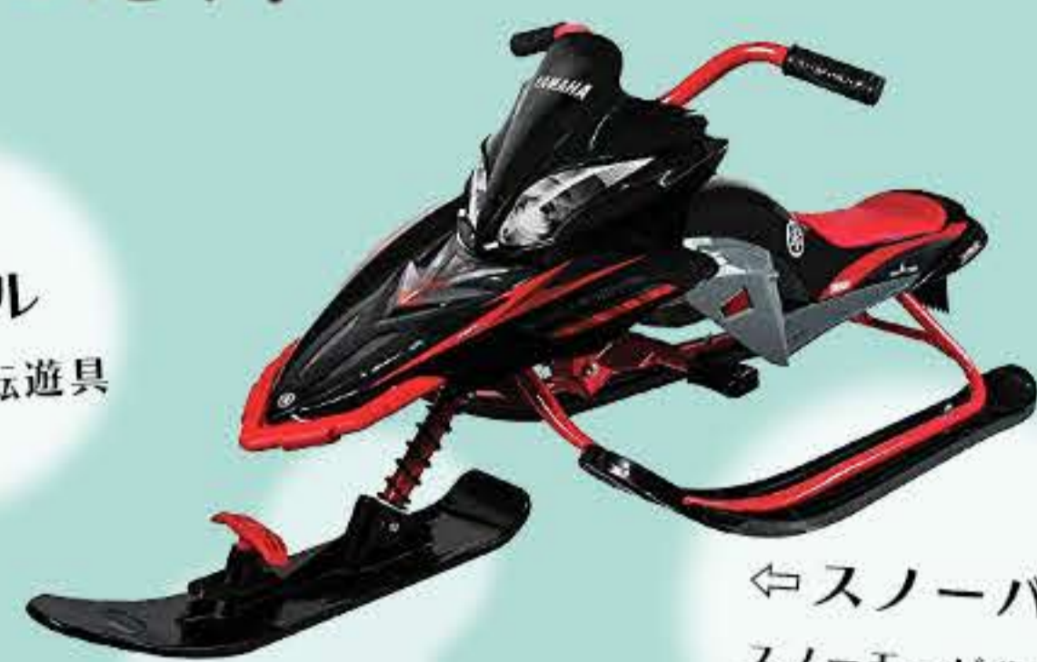
⇐スノーバイクソリ スノーモービルをモデルにした子供用のソリ